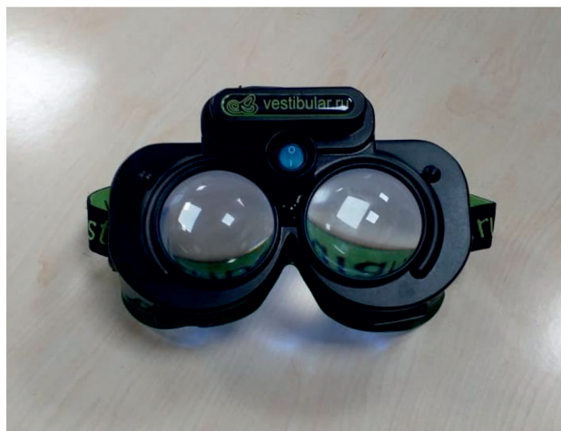
Рисунок 2 – Очки Френзеля

Curthoystest), которые проводятся с использованием очков Френзеля (рис. 2).